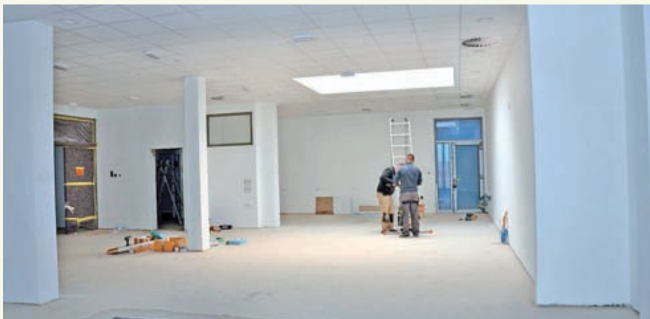
Večja gradbena dela v Krajevni knjižnici Trata so že končana. Odprtje je predvideno septembra.

V fazi podpisovanja pogodb so projekti prenove mrliške vežice na Mestnem pokopališču; za obnovo vodovoda v naselju Podlubnik ter za prenovo vodovoda Pod Plevno; v fazi pregledovanja prejetih ponudb so projekti za kolesarsko povezavo Brode–Gabrk, za komunalno ureditev Grajske poti in izgradnjo kanalizacije pri Sv. Duhu. V pripravi je razpisna dokumentacija za kolesarsko povezavo Škofja Loka–Trata na odseku od Turizma Škofja Loka do krožišča pri Starem dvoru. Predvidena je tudi obnova Partizanske ceste z izvedbo ukrepov za bolj varen promet, prenovo ceste in infrastrukture. Ob vsem tem nameravajo na škofjeloški občini predvidoma še letos objaviti razpise za pripravo dokumentacije za vodovod in cesto v Gorajtah, za vodovod v Hotovlji ter za vodovod in kanalizacijo v Hrastnici.