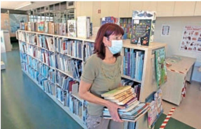
Od začetka maja je v Knjižnici Ivana Tavčarja Škofja Loka spet možna izposoja gradiva, a pod posebnimi pogoji.

Knjižnica Ivana Tavčarja Škofja Loka in vse njene enote so od ponedeljka, 4. maja, dalje odprte za izposajo gradiva po rednem urniku, vsi dogodki pa so še naprej odpovedani.