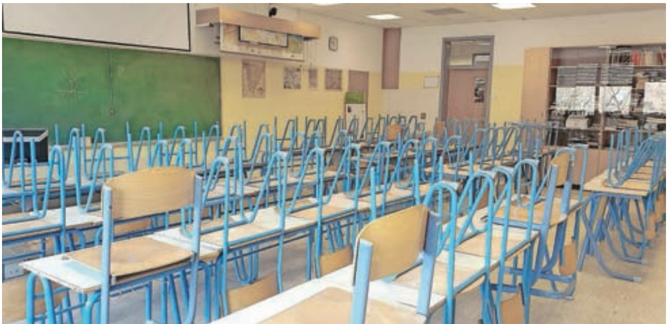
Učilnice bodo samevale še do 18. maja, ko se v šolo vračajo letošnji maturanti.

Tako kot v drugih šolah so tudi v škofjeloški gimnaziji pogrešali bolj redne in popolne informacije s šolskega ministrstva. »Pojavljajo se recimo vprašanja, kako nadomestiti laboratorijsko delo, ki ga zdaj dijaki ne morejo opravljati, pa tudi glede ocenjevanja.« V šoli so tako pripravili dopolnitve šolskih pravil ocenjevanja v času epidemije, ki so jih uskladili tudi z dijaško skupnostjo in starši, da bi se formalno pripravili tudi na morebitno ocenjevanje. »Poudarek bo na ustnem ocenjevanju, pa tudi alternativnih oblikah preverjanja in ocenjevanja znanja, kot so projektno delo, seminarske naloge,