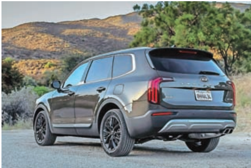
Svetovni avto leta 2020 kio telluride ni naprodaj v Evropi.

R azglasitev svetovni avto leta 2020, ki je bila doslej vezana na tradicionalni avtosalon v New Yorku, je letos šla mimo skoraj neopazno. Žirija iz 24 držav, v kateri sodeluje tudi slovenski predstavnik iz revije Finance, je letos v začetku aprila po elektronski komunikaciji za svetovni avto leta izbrala srednje velikega luksuznega terenca kio telluride in za svetovnega mestnega malčka električno kio soul. Kia telluride je v ožjem izboru premagala mazdo CX 30 in mazdo 3, kio soul pa je v najožji kokurenci ugnala električnega minija in volkswagen t