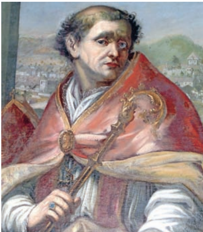
Freisinški škof Abraham

trgu zaradi optimalne izrabe prostora postavljene strnjeno ena ob drugo. Parcele so bile ozke in dolge, na trg je gledalo glavno pročelje hiše, za stanovanjskim poslopjem pa so bili gospodarski objekti in vrtovi. Sprva so bile hiše v Škofji Loki preproste lesene, enonadstropne, pokrite z dvokapno streho, krito z lesenimi skodlami. Leta 1511 je mesto prizadel rušilni potres, kar je, poleg nastopa renesanse, močno vplivalo tudi na zunanjščino mestnih stavb. Prvotne enonadstropne, večinoma lesene hiše so sedaj zamenjale dvonadstropne kamnite hiše. Strogo funkcionalnost so obogatili dekorativni elementi, fasade so razgibali nadstropni pomoli oziroma so jih poživile slikarske in kiparske dekoracije. Za mesto se je začel uporabljati izraz »pisana Loka«. V 17. stoletju sta Škofjo Loko prizadela dva huda požara. Po obnovah je renesančni videz mestnih hiš sčasoma delno zakrila baročna preobleka, svoje pa so k spreminjanju mestne vedute prispevala tudi kasnejša stilna obdobja vse do današnjega časa. Vendarle pa v jedru Škofja Loka še vedno skriva svoje ne le renesančno, temveč celo srednjeveško srce, ki mestu daje pridih starodavne mističnosti.