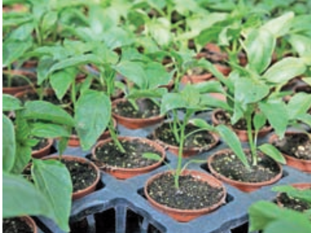
Vse več ljudi na svojih balkonih goji zelenjavo. Na fotografiji so sadike paprike.

Ljubitelji rastlinja pa na balkone vse pogosteje nameščajo tudi korita z zelenjavo. Vrtnarije in cvetličarne so bile v prvih tednih epidemije zaprte, ko pa so dobile dovoljenje za ponovno obratovanje, pa so po besedah Antolinove ljudje rastline navdušeno začeli kupovati. »Prvi naval kupcev je množično povpraševal po sadikah zelenjave. Trend domačega in lokalno pridelanega se povečuje in je vedno bolj cenjen. Ljudje zelenjavne sadike, kot so solata, paradižnik, peteršilj, tudi začimbe, enako kot rože zasajajo v korita in postavljajo na balkone,« je zaupala sogovornica, ki opaža, da se tudi vse več mladih odloča za gojenje domače zelenjave. Ko so korita zasajena z rastlinami in že krasijo naš balkon, moramo zanje