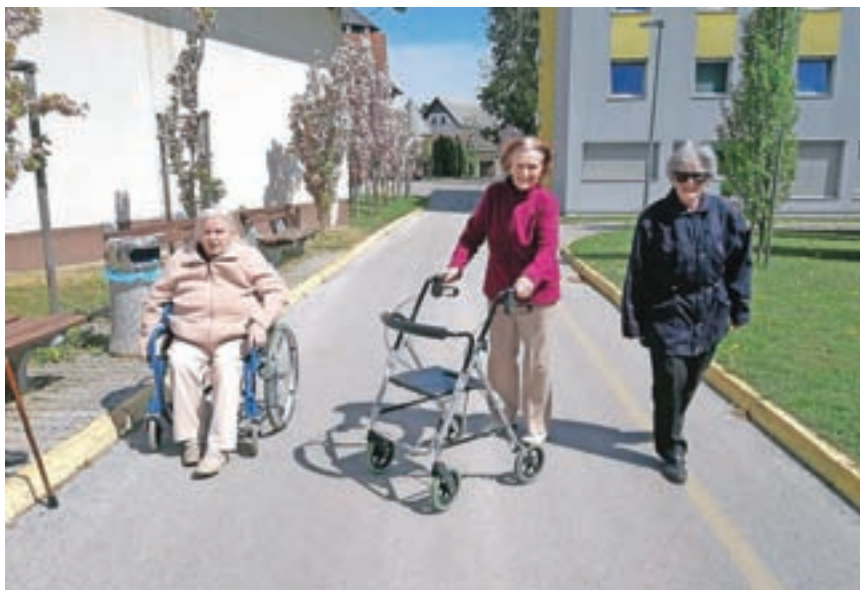
Štejejo kroge, ki jih naredijo po dvorišču doma.

nas naša terapevtka, ki je dopoldan z nami, kar naprej spodbuja in usmerja, da nam ni nikoli dolgčas. Lepo se imamo in ničesar ne pogrešam, razen obiskov.«