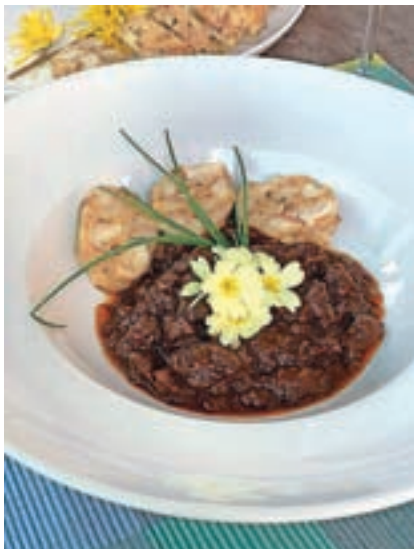
Nekateri so poskrbeli za domiselno okrasitev ...

tudi majice za vse udeležence v spomin na dogodek, ki »je bil v težkih časih prav posrečen način socializacije in 'druženja'«. Ena od nagrad bo tudi članstvo v žiriji prihodnje leto, ko naj bi Virtualno golažijado ponovili. »Upam, da v drugačni obliki in pod drugačnimi pogoji,« je še dejal Ferlan.