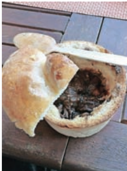
... drugi pa za domiselno postrežbo. / Foto: Nejc Ovsenek