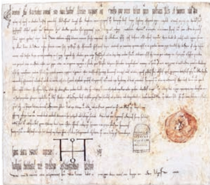
Darilna listina nemškega cesarja Otona II. freisinškemu škofu Abrahamu iz leta 973

Ime Lonca, ki nam ga sporoča darilna listina cesarja Otona II. iz leta 973, se ne nanaša na Škofjo Loko, ampak na bližnjo, današnjo Staro Loko. Ker je bilo območje Stare Loke manj primerno za razvoj modernega srednjeveškega naselja, so se škofje odločili, da bodo v zavetju gradu, ob sotočju Selške in Poljanske Sore, postavili povsem novo naselje – Škofjo Loko, katere začetki segajo v 12. stoletje.