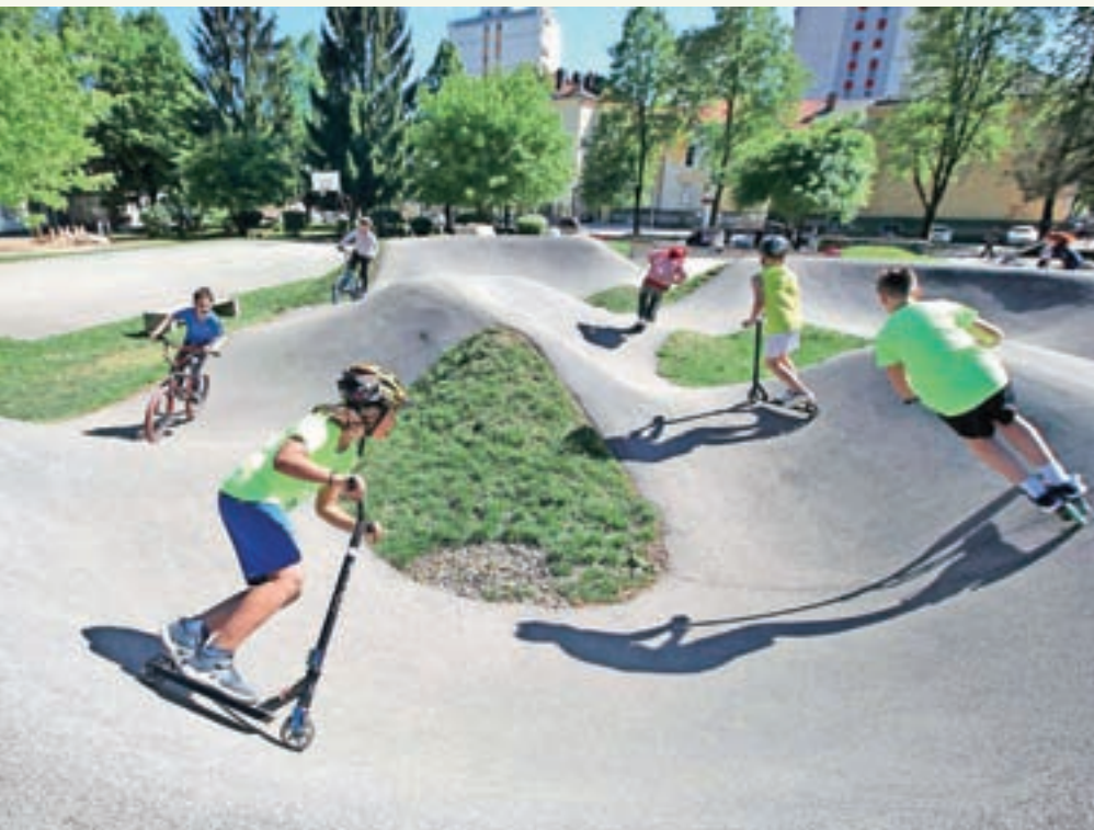
Ponovno je dovoljena uporaba telovadnic v naravi in kolesarskega parka na prostoru nekdanje vojašnice.

Naenkrat se je sprostilo veliko ukrepov. Ob upoštevanju strogih pravil, ki so za vse nova, prihaja do zastojev, zato vsi lepo prosijo za razumevanje in seveda upoštevanje varnostnih ukrepov.