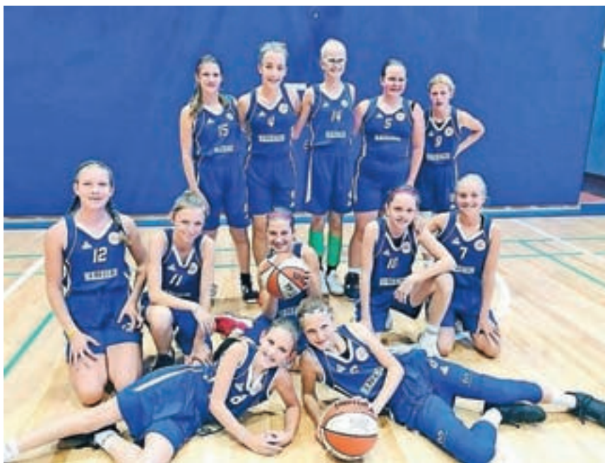
Za največji uspeh deklet je s šestim mestom poskrbela ekipa selekcije do trinajst let.

»Na informacijo, da se je sezona predčasno končana, so se dekleta odzvala z velikim razočaranjem, saj so bile pred vrati najpomembnejše tekme sezone. Smo pa ves čas