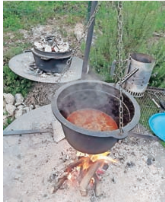
Kuhanja karantenskega golaža se je vsak lotil na svoj način.