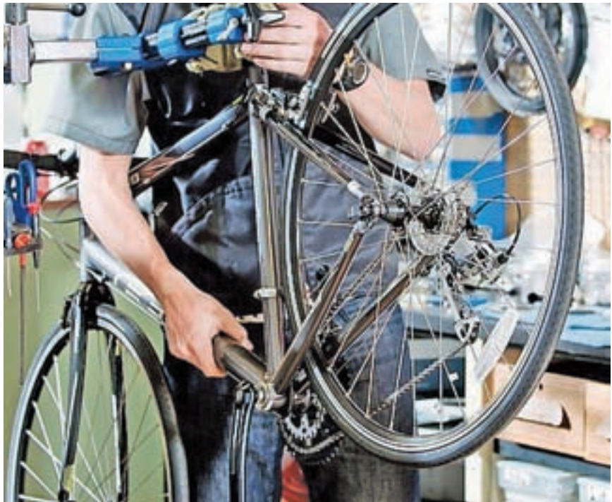
Zahtevna opravila prepustite serviserju.

Pregleda glavnih sklopov kolesa in posameznih elementov se lahko