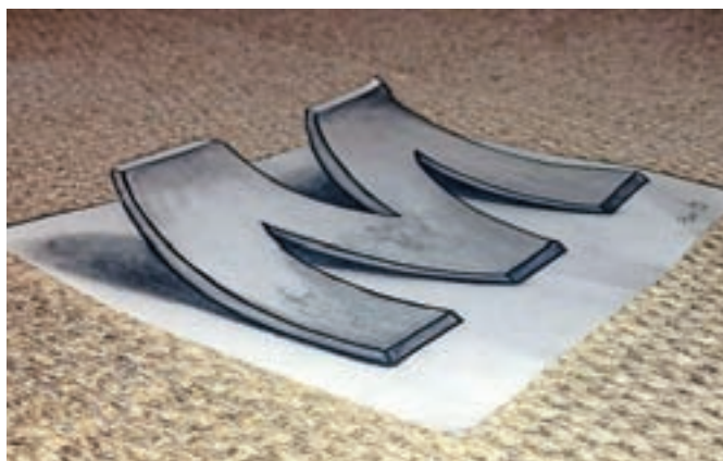
Optična iluzija Eme Balanč

Z ostalimi dijaki bodo nadaljevali pouk na daljavo kot doslej, pri čemer upa, da bodo po 1. juniju lahko v šolo prišli tudi dijaki z negativnimi ocenami, da jih popravijo v živo, ne prek računalnika. »Kot kaže, bomo z dijaki na daljavo na podobne načine kot doslej delali še kar nekaj časa. Zato želimo, da bi bilo delo naših strokovnih delavcev v virtualnih učilnicah prav tako uspešno kot delo v resničnem okolju,« je dejal Bogataj in dodal, da se zelo trudijo, da pouk popestrijo tudi z