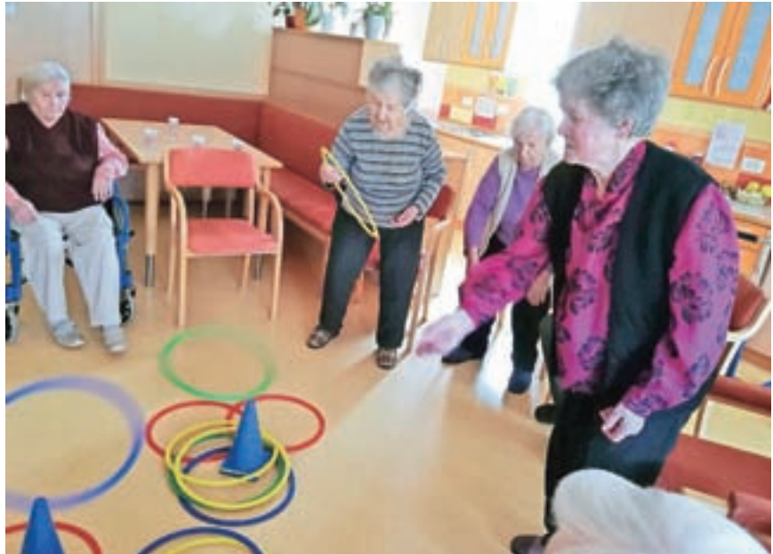
Zabava in krepitev spretnosti

Ob koncu aprila so nam poslali zapis, v katerem so strnili svoje vtise o tem, kako se imajo in kaj počnejo, medtem ko so zaradi koronavirusa prisiljeni v izolacijo. »V tem času so naše oddelke spremenili v sa-