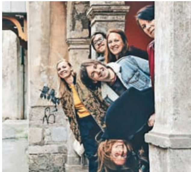
Člani Kulturnega društva Grable, društva za kreativno grabljenje sveta, so se povezali in začeli ustvarjati tisto, kar so pogrešali – zgodbe.