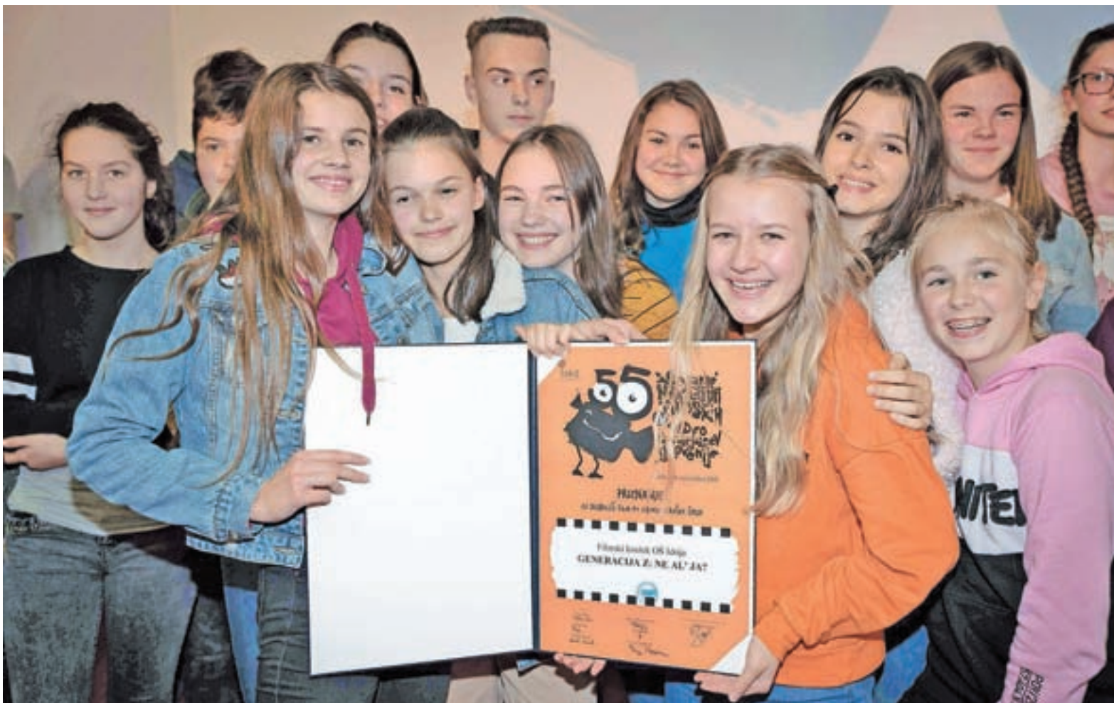
Učenci po zmagi na 55. Srečanju mladih filmskih in video ustvarjalcev Slovenije

Vsekakor, ravno ta film je velik dokaz, kaj vse mladi lahko dosežejo, če si upajo narediti korak naprej, morda tudi v neznano, kar so s tem filmom naredili naši učenci. Moram pa reči, da so bile izkušnje odlične, presenetilo nas je, kako močan vtis je film naredil na vse, še posebno na njihove vrstnike. Učitelji in starši lahko na neki način spodbujajo odgovorno vedenje, a če to izpostavijo njihovi vrstniki, je to povsem nekaj drugega. V tujini, kjer sem imel možnost prisostvovati projekciji, so tam-