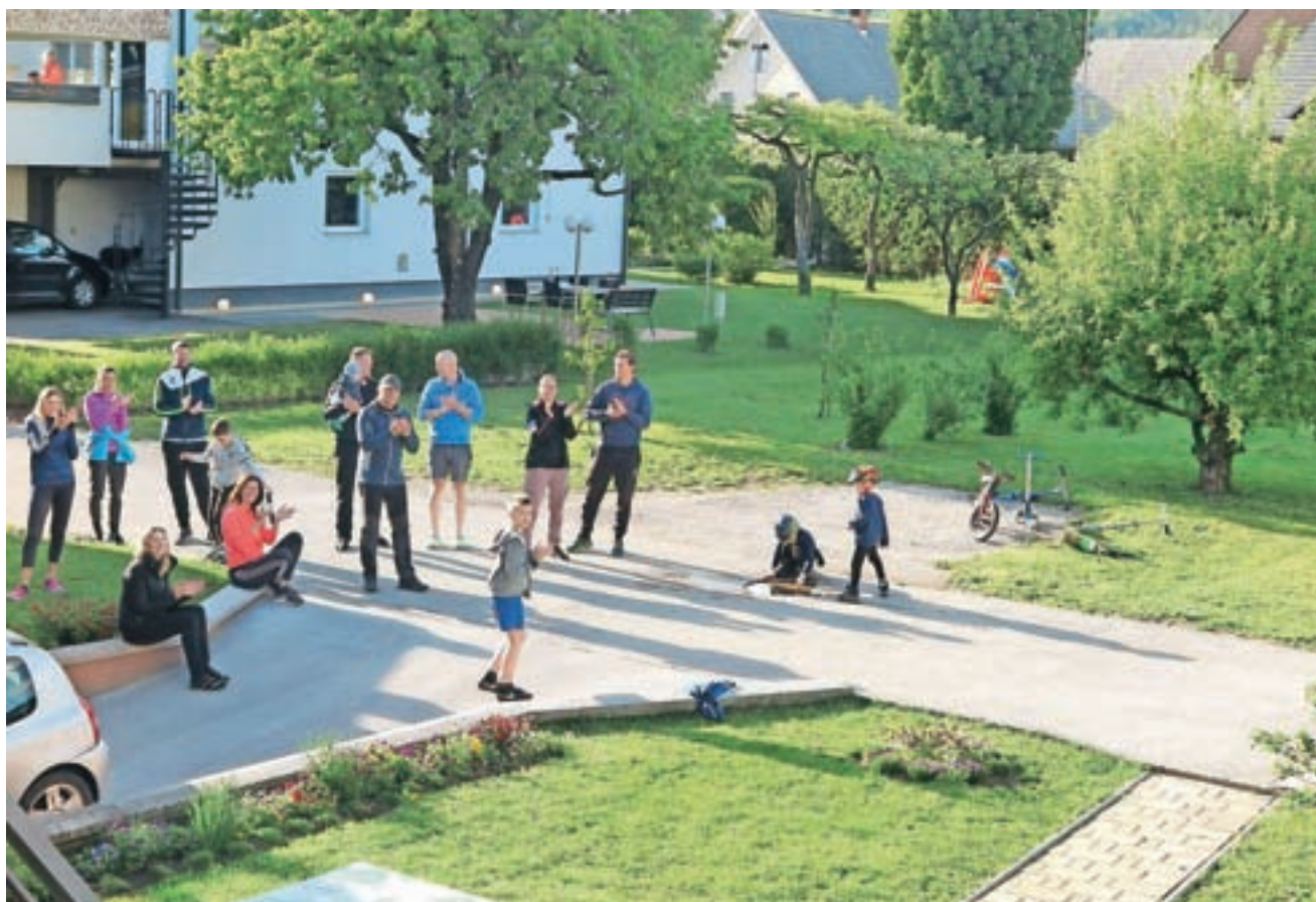
Prvo majsko nedeljo so se poslušalci na balkonih pridružili tudi domačini s sosednjih ulic.