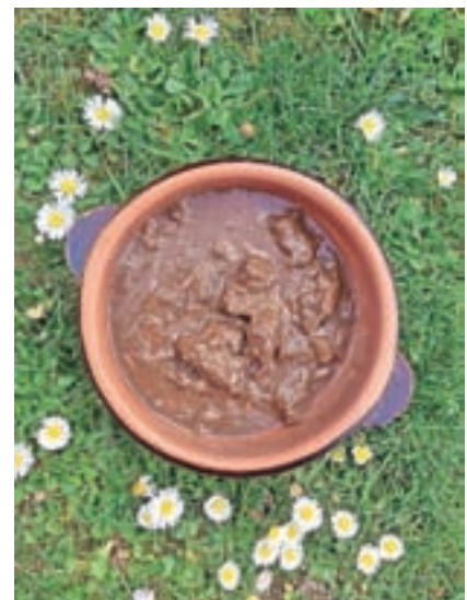
Golaž so ocenjevali zgolj na podlagi videza.