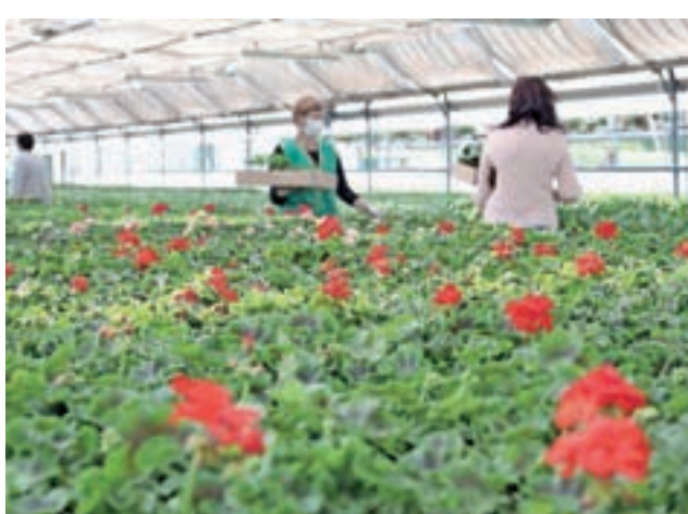
Cvetoče rože so bile od nekdaj priljubljene za okrasitev balkonov. Na fotografiji so pelargonije.

Ljubitelji rastlinja pa na balkone vse pogosteje nameščajo tudi korita z zelenjavo. Vrtnarije in cvetličarne so bile v prvih tednih epidemije zaprte, ko pa so dobile dovoljenje za ponovno obratovanje, pa so po besedah Antolinove ljudje rastline navdušeno začeli kupovati. »Prvi naval kupcev je množično povpraševal po sadikah zelenjave. Trend domačega in lokalno pridelanega se povečuje in je vedno bolj cenjen. Ljudje zelenjavne sadike, kot so solata, paradižnik, peteršilj, tudi začimbe, enako kot rože zasajajo v korita in postavljajo na balkone,« je zaupala sogovornica, ki opaža, da se tudi vse več mladih odloča za gojenje domače zelenjave. Ko so korita zasajena z rastlinami in že krasijo naš balkon, moramo zanje