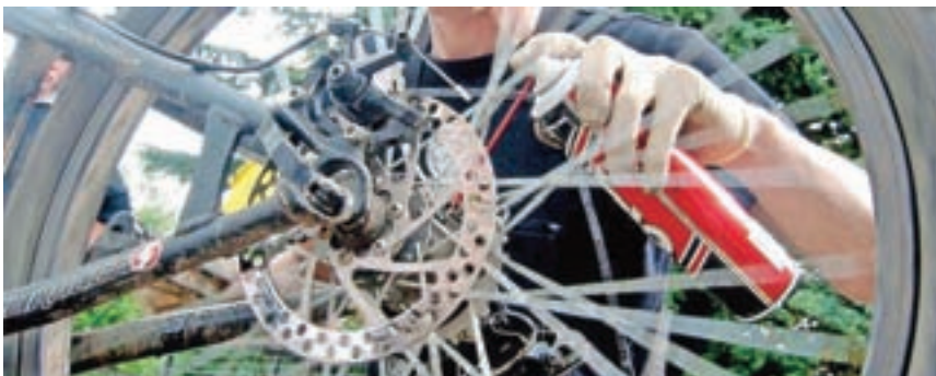
Za mazanje verige uporabite zgolj namenska maziva. Nikoli ne mažite umazane verige.

Dobro nastavljene zavore so pogoj za varno vožnjo. Iztrošene zavorne gumice pomenijo obrabo obroča in tudi slabše zaviranje. Zavorne obloge morajo biti poravnane z obročem in morajo nanj pritiskati enakomerno in s celo površino obloge. Razdalja med oblogo in obročem mora biti 1,5–2 mm in na obeh straneh čeljusti enaka. Razdaljo se nastavlja tudi s pomočjo nastavitvenih vijakov. Zavorne obloge postanejo s starostjo trde in ne zagotavljajo več varnega zaviranja. V takih primerih jih zamenjajte ne glede na obrabljenost.