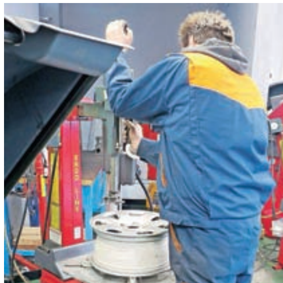
Letos pri vulkanizerjih brez posebnih čakalnih vrst